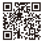
実行委員会サイト