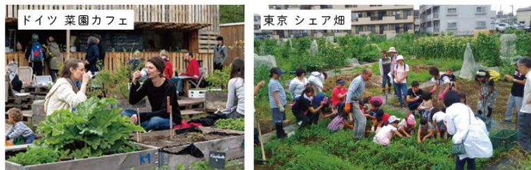
食を通じて市民が自主的に参加する広場のイメージ図