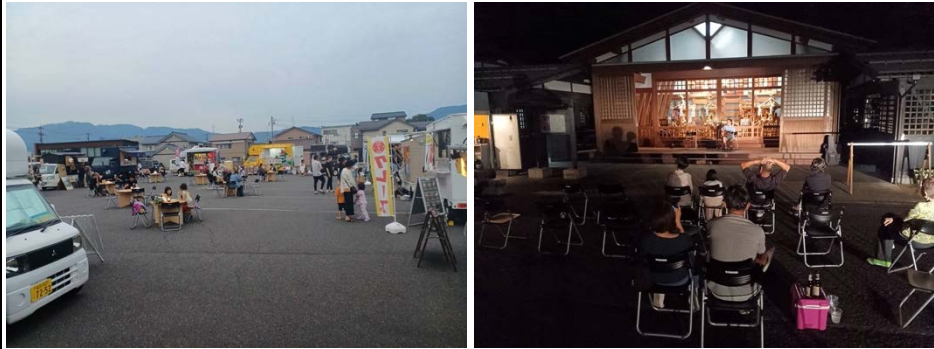
毎月第四木曜日に実施しているナイトマーケット

一方で、街路灯の有無、電気容量などの課題があり、人が集まることを想定して、持続的に活用するための再整備の必要性が散見されました。