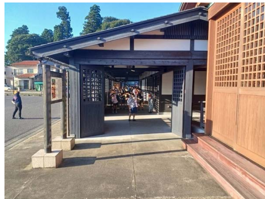
夏休みに実施したラジオ体操